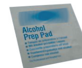
丸形トレイ及び 拭き取りペーパー