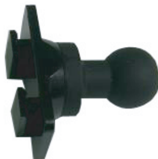
ポータブルナビ用 2口タイプホルダー (基本付着)