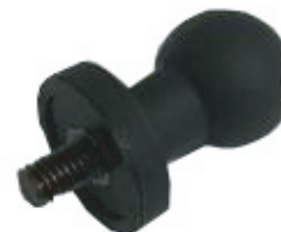
デジタルカメラ用 ホルダー