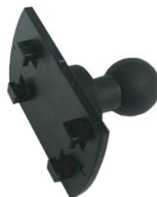
ポータブルナビ用 4口タイプホルダー