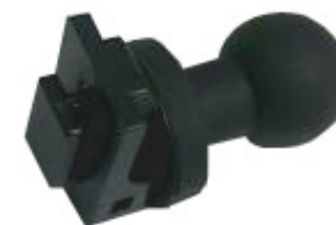
ポータブルナビ用 1口タイプホルダー