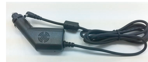
AI-711HV専用 シガーライターアダプタ 出力:DC12V