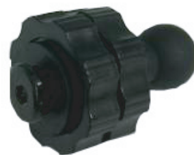
レール用 1口タイプホルダー (基本付着)