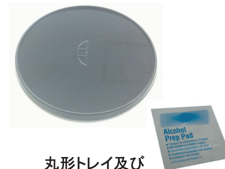
丸形トレイ及び 拭き取りペーパー